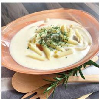
砂谷牛乳のクリームシチュー 1,080円