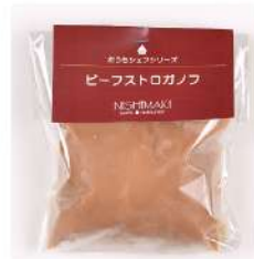
ビーフストロガノフ 1,080円(320g)