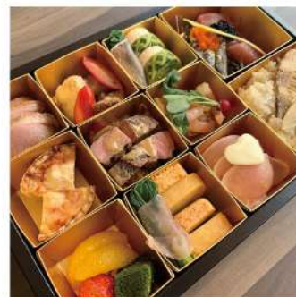
にしまきの洋風折詰 1人前 5,400円～ ※お早めにご予約ください