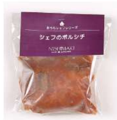
シェフのボルシチ 1,080円(320g)