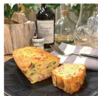
小松菜とベーコンのケーキサレ 1,080円

フランスの甘くないケーキ。小松菜、ベーコン、ちりめん、チーズを入れて焼き上げました。