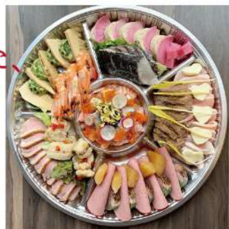
オードブル盛り 1人前 2,160円～ 3名様から受付