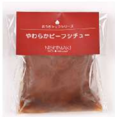
やわらか ビーフシチュー 1,080円(320g)