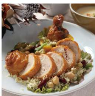
肉詰めチキングリル 1,080円

継ぎ足しのシェフ特製ダレが浸みているので、そのままでも美味しい、唯一無二の味です。