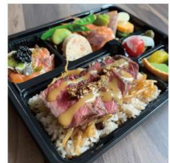
さらに DX なステーキ弁当 3,240円～ 牛フィレ肉のステーキでさらに豪華!